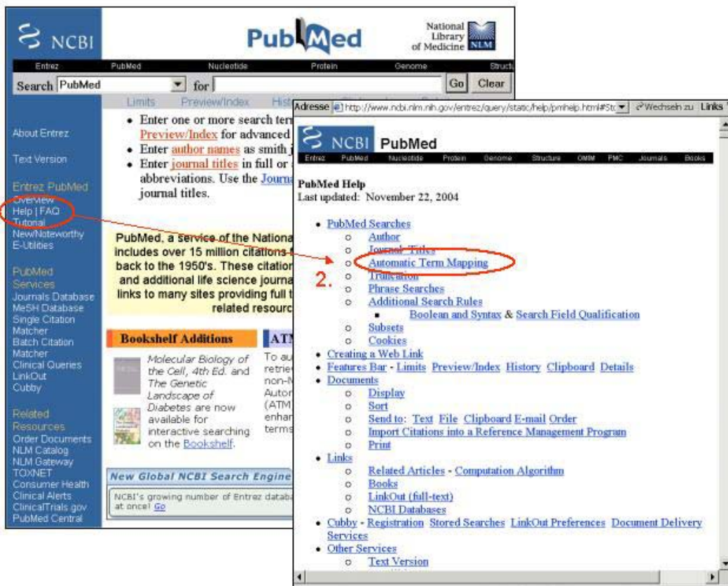
Abb. 2: Help-Link auf der PubMed-Startseite

Deutsche Zahnärztliche Zeitschrift 60: 67-68 (2005)