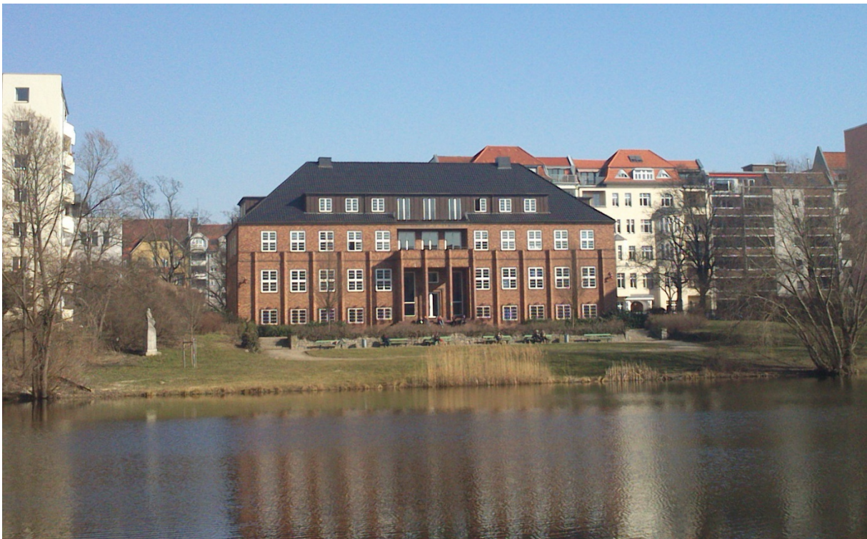
Die Geschäftsstelle befindet sich im Gebäude der Krebsgesellschaft am Lietzensee in Berlin Charlottenburg.